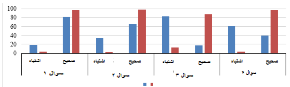
جدول شماره ۱: نتایج درصد جواب درست و اشتباه برای هر سوال قبل و بعد از نمایش فیلم