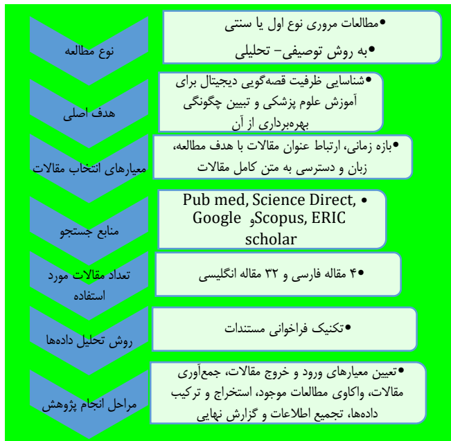
شکل ۱. ارت چه ما مطالعه

چارت پریزما اطلاعات اصلی و مهم مربوط به مطالعه ارائه شده است.