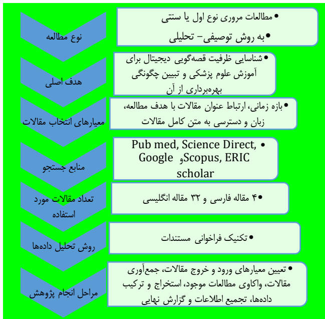
شکل ۱- چارت پریزما مطالعه

چارت پریزما اطلاعات اصلی و مهم مربوط به مطالعه ارائه شده است.